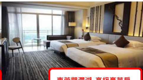
東莞觀瀾湖-高級豪華房