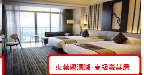
東莞觀瀾湖-高級豪華房