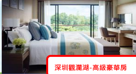
深圳觀瀾湖-高級豪華房