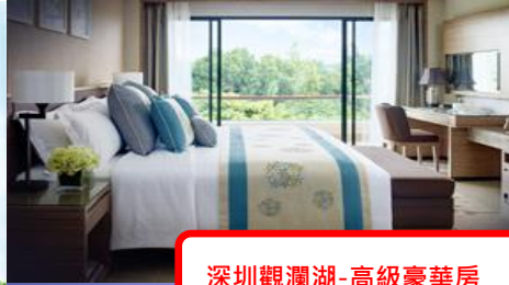
深圳觀瀾湖-高級豪華房